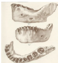
La mâchoire de La Naulette (Dupont 1866a : pl.).

Il explore une soixantaine de grottes de sa région natale, dont une vingtaine sur les versants de la vallée de la Lesse. Quatre cavernes (trous) sont particulièrement célèbres : le trou du Frontal, le trou de Chaleux, le trou Magrite et la caverne de La Naulette. Dégagés par Dupont et conservés à l'Institut royal des Sciences naturelles de